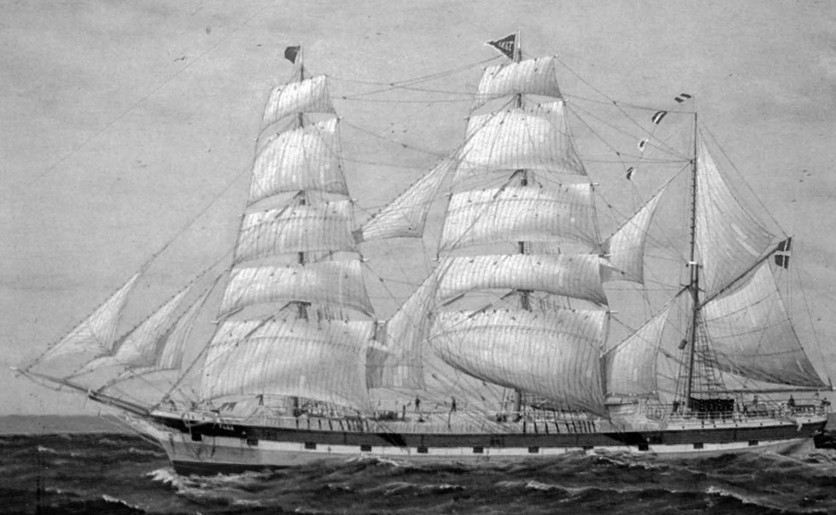
Barkskeppet "Tana" - Rååflottans stolthet för fulla segel. Oljemålning på museet.

arbetet på däck, då nästan all däckslast var bortspolad till förkant på skansen, som låg kvar och utgjorde ca 6 kubikfamn. Storluckan blef då åter skalkad med dubbla pressningar. Kl. 8.30 fm blef pumpen pejlad och befanns då 13 tum vatten i fartyget. Gjorde då strax i ordning att pumpa läns men på grund av fartygets slingring fick endast slingerläns. Kl. 10 fm sattes båda undra märseglen. Kl. 1 em blef besättningen kallad akter för att hålla skeppsråd och besluta hvad som skulle göras för att få fartyget manöverfärdigt därför att fartyget låg