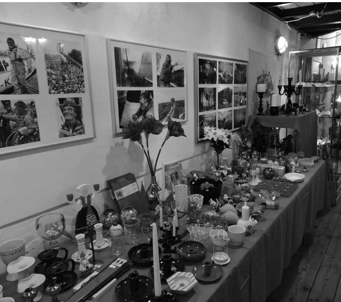
Ett brett sortiment på loppmarknaden.