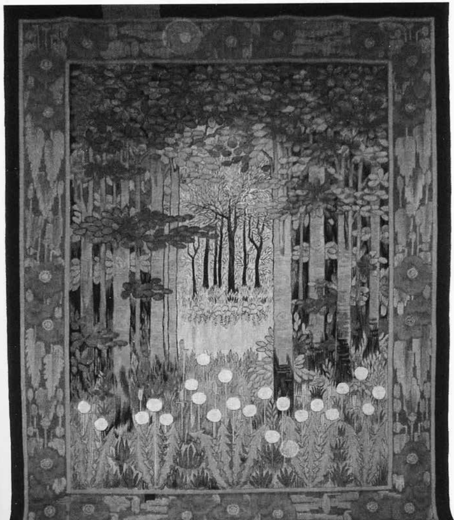
Den Jugendinspirerade bonaden, Skogstjärn, uppmärksammades i den engelska tidskriften "The Studio" 1905.