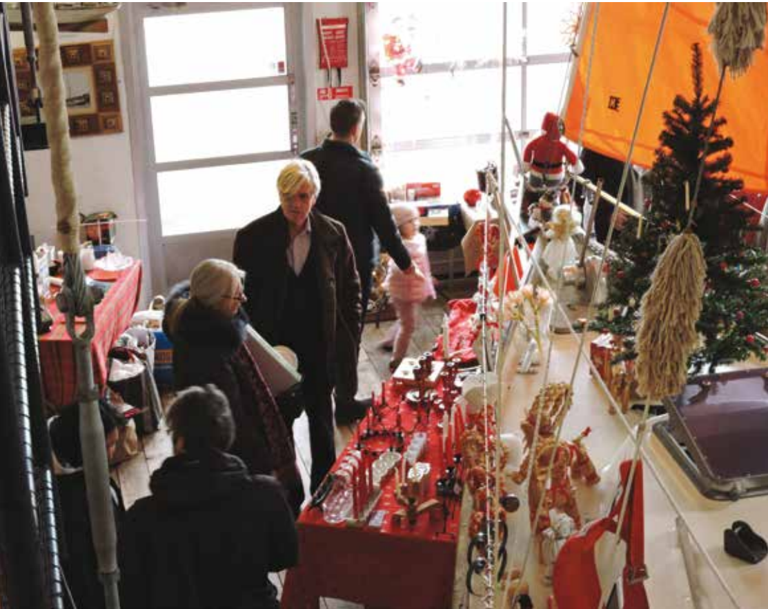
Julmarknad i båthallen.