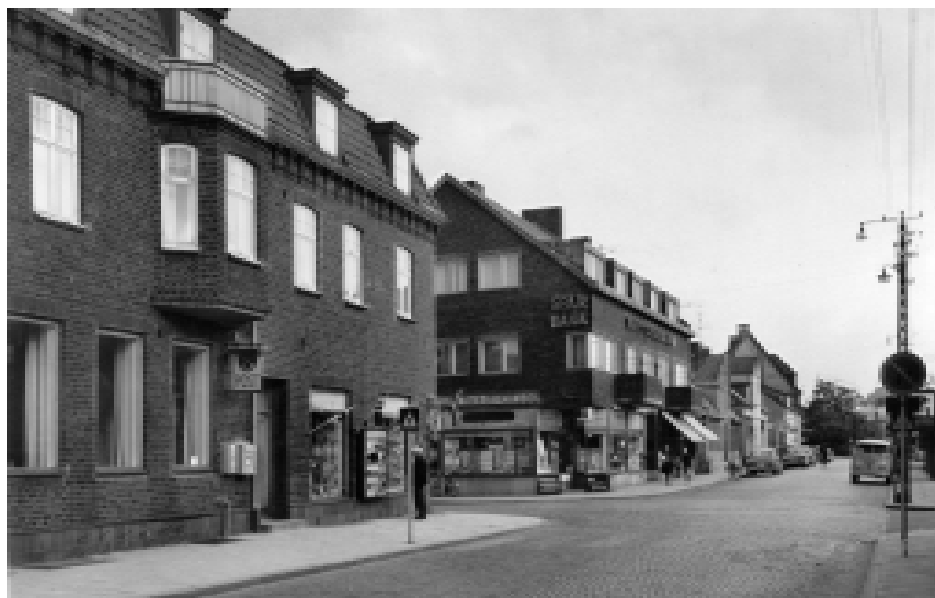
Efter ombyggnaden 1930 flyttade järnaffären in i södra delen av huset. Till husets norra del flyttade Råsås poststation.