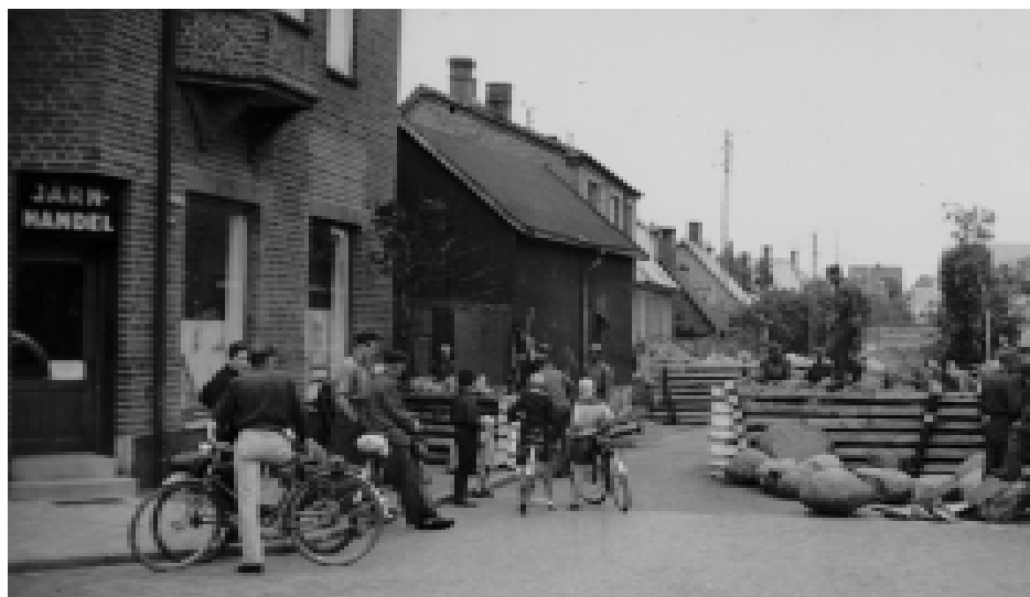
Stridsvagnshinder byggs utanför järnaffären under andra världskriget.