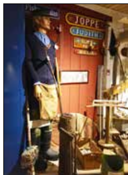
Modell av fiskare med utrustning för att fånga sandworm.