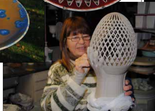
Utskärning av nätägglampa.

borgsskolan 2013, där alla barnen fick göra sin konst under min handledning, även barnen på Lunnaskolan i Kågeröd. 2011 fick jag äran att göra Livets Pärlor till Mariakyrkan i Helsingborg. Har även fått en hel del andra utmaningar som t.ex. en hel matservis 1984 till Nunnorna på Karmeliterklostret i Glumslöv, julkrubba med 20 figurer till Den Gode Herdens kyrka i Helsingborg. Barnen som döps i Svalövs kommun får en handjord dopljusstake och dopdroppe som jag tillverkar.