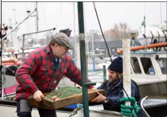
En färdig tru lastas ombord på Fri.