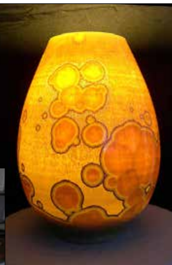
Lampa i transparent porslinslera med kristallglasyr.