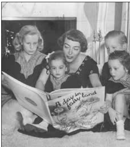
Joan Crawford läser A day in fairyland för sina fyra barn.