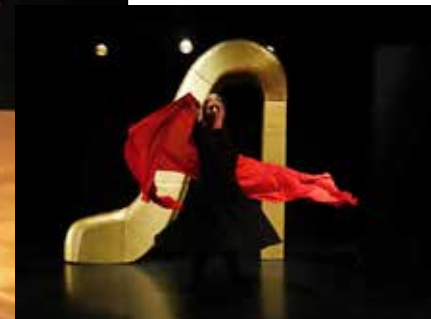
Slutsenen i My Dance där kvinnan väljer sin egen väg bortom alla regler.

Sedan början på 90-talet har jag turnerat med min dockteater i hela landet från Malmö i söder