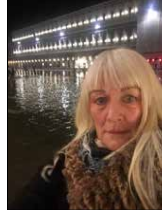
Piazza San Marco i mars 2018. Högvattnet blir värre för varje år. Snart tränger det in i cafeterierna som omger platsen.