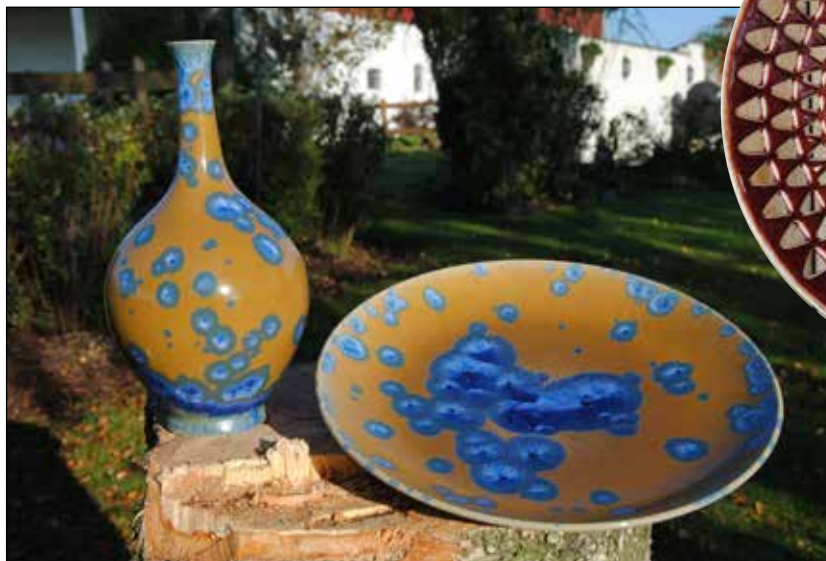
Vas och fat i blå kristallglasyr.

När jag var sexton år flyttade jag ner till Skåne för att arbeta på djursjukhuset i Helsingborg. Mitt intresse för lera förde mig till en kvällskurs i keramik och det dröjde inte länge,