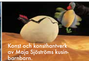
Konst och konsthantverk av Maja Sjöströms kusin- barnbarn.