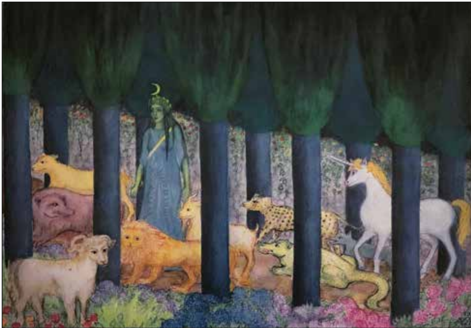
Artemis, De Vilda Djurens Gudinna. Bokillustration ur Mileniaden, Milenas underbara resa till San Michele.

En mörk kväll i mars för ett år sedan befann jag mig på Piazza San Marco i Venedig. Lagunen hade svämmat in över hela platsen och man måste förflytta sig på meterhöga gångbroar. Ljusen från kafeerna runt Piazzan speglade sig i vattnet som en stjärnhimmel.