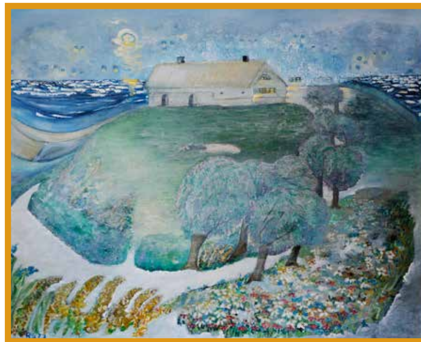
Oljemålning från Ven