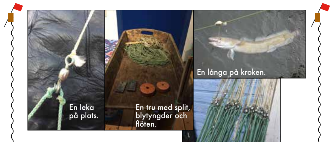
En leka på plats.