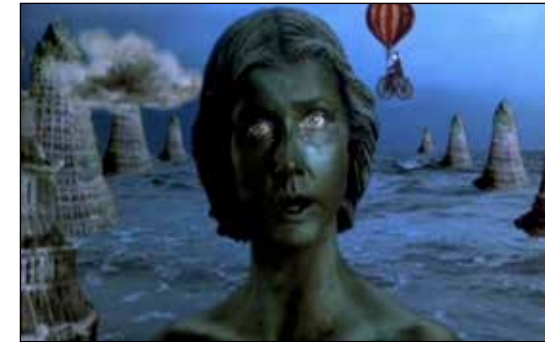
Dea Marina sjöjungfrun.