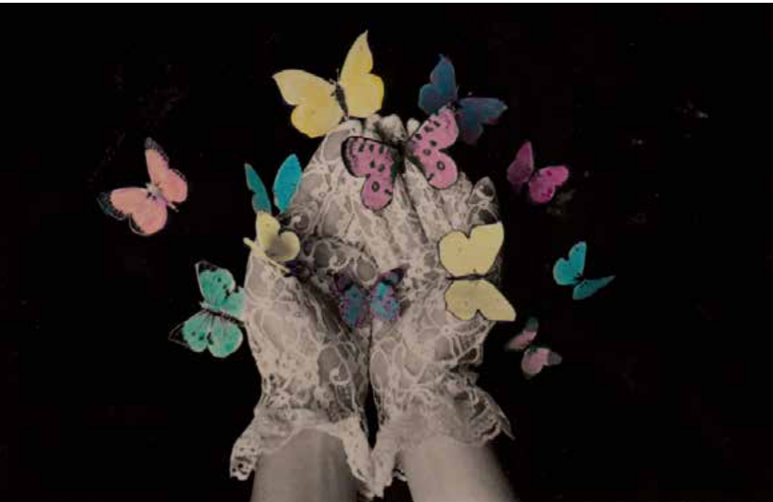
En liten film för mina systrar.

Jag är utbildad vid Royal College of Art i London, där jag studerade på 70-talet. Royal College är en konstskola med en filmavdelning och jag blev påverkad av en konstorienterad syn på film som ett visuellt medium där bildspråket är centralt.