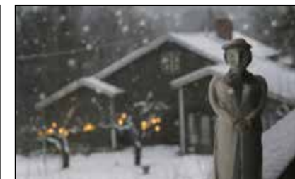
Lerfigurer vid barndomshemmet.