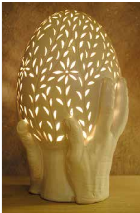
Skulpterad och genombruten ägglampa.

Jag är keramiker i Sireköpinge, Svalöv sedan 1972 och driver där mitt företag Sireköpinge stengods. Född i Umeå och bosatt i Skåne sedan 1967.